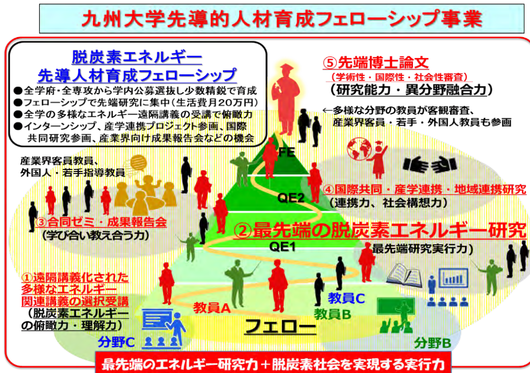
図1: 脱炭素フェローシップの概要

本フェローシップにおける研究力向上とキャリア形成のプログラムの詳細は、別紙の表に示す。