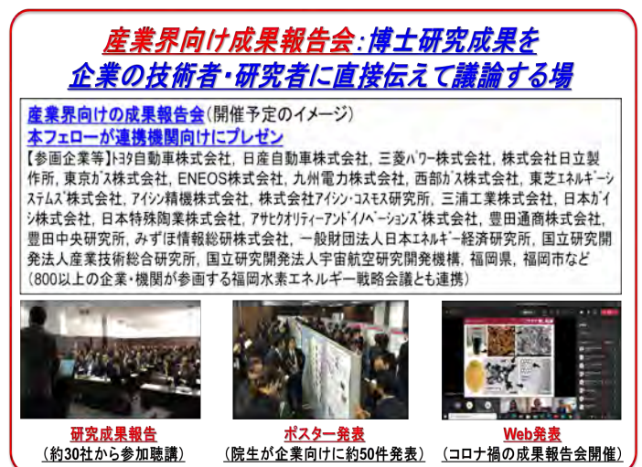
図3: 研究力向上とキャリアパス形成の場となる「産業界向け成果報告会」の概要