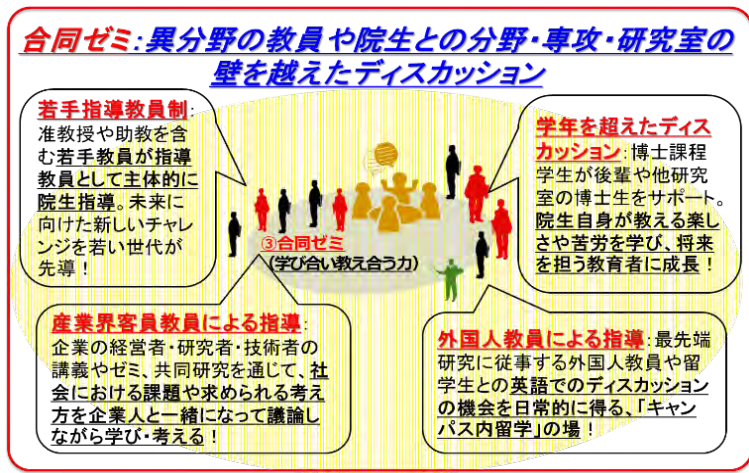
図2: 多様な分野の研究者との議論で研究の幅や視野を広げる場となる「合同ゼミ」の概要