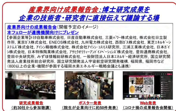
図3: 研究力向上とキャリアパス形成の場となる「産業界向け成果報告会」の概要