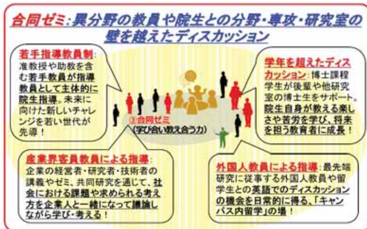
図2: 多様な分野の研究者との議論で研究の幅や視野を広げる場となる「合同ゼミ」の概要