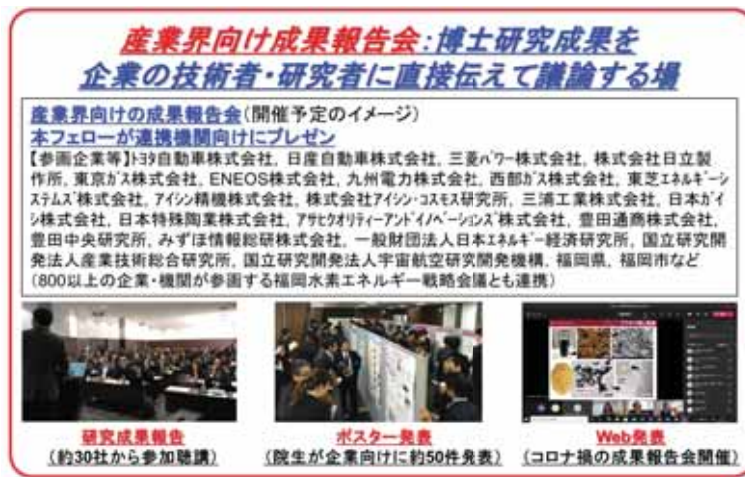
図3: 研究力向上とキャリアパス形成の場となる「産業界向け成果報告会」の概要