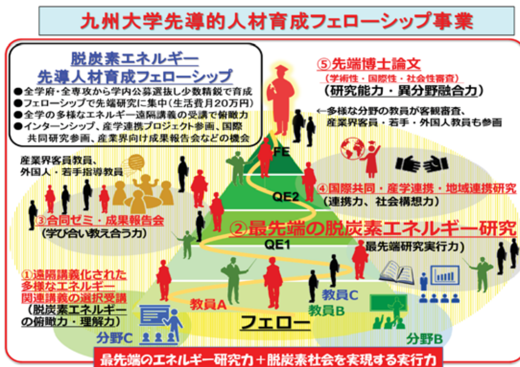
図1: 脱炭素フェローシップの概要

本フェローシップにおける研究力向上とキャリア形成のプログラムの詳細は、別紙の表に示す。